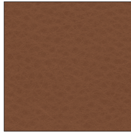
20.58 saddle brown