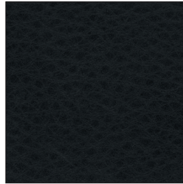
20.33 midnight black